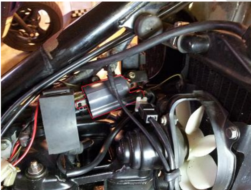
De plaats van de bobine, onder de tank.

- Omdat dit een TCI-bobine is, moet één kant 12 Volt zijn. Hiervoor dient u de bijgeleverde rode draad aan de + pool van de accu te bevestigen. Leg de draad via de kabelboom naar de TCI-bobine. U dient de draad te bevestigen op de pin van de TCI-bobine waar een “ + “ teken bij staat.